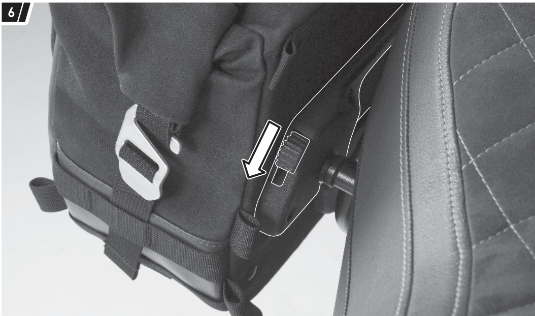
Befestigung und Fahrzeug dienen als Beispiel. / Fixation and vehicle are examples.

Drücken Sie zum Entriegeln der Seitentasche (1a/1b) einfach den gezeigten Schieber des Verschlussmechanismus nach unten.