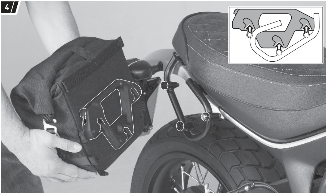
Befestigung und Fahrzeug dienen als Beispiel. / Fixation and vehicle are examples.

Setzen Sie die drei Öffnungen des Schnellverschluss-Systems auf die Aufnahmebolzen des montierten SLC Seitenträgers.