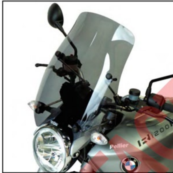
fissaggio in basso